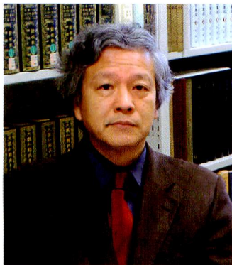
COEプログラム拠点リーダー 東アジア学術総合研究所